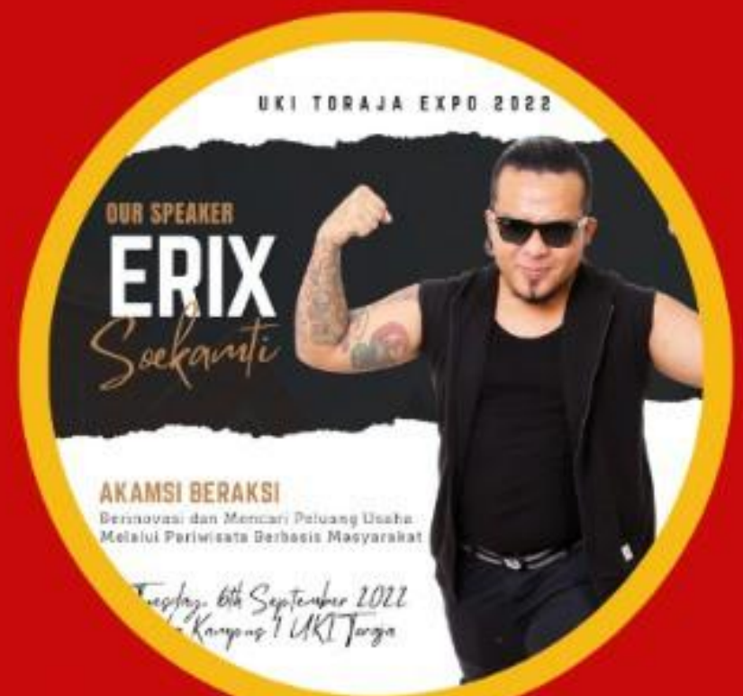
UKI Toraja Expo 2022