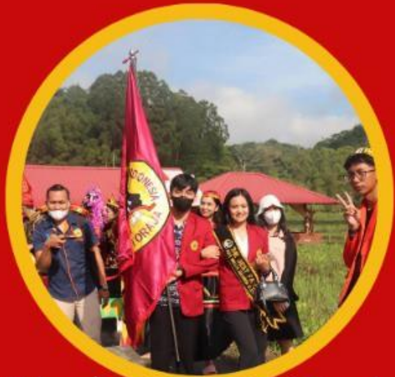
Dies Natalis UKI Toraja