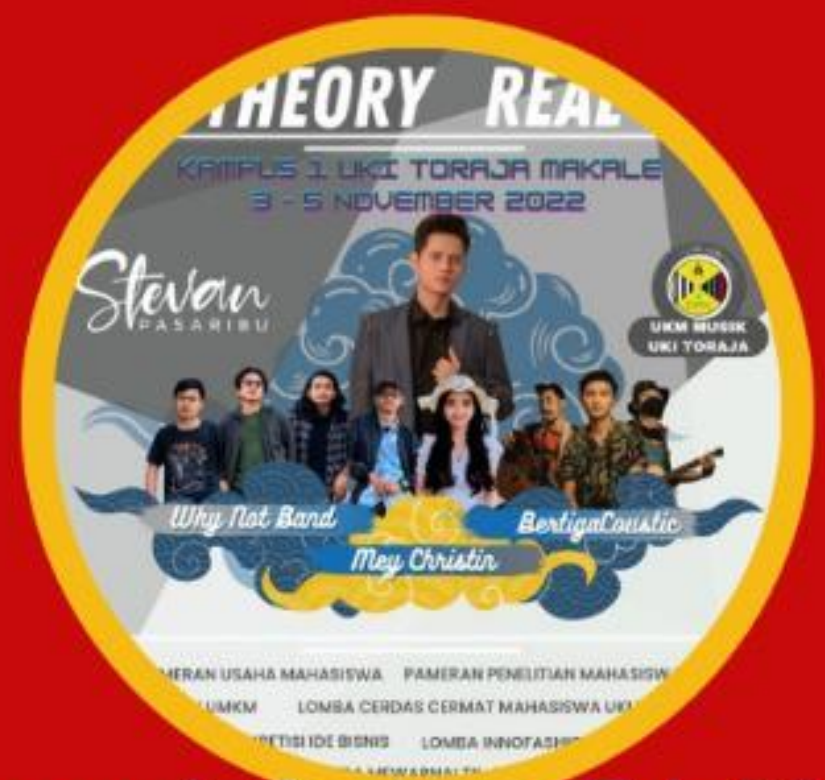
Economic Business Fair 2022