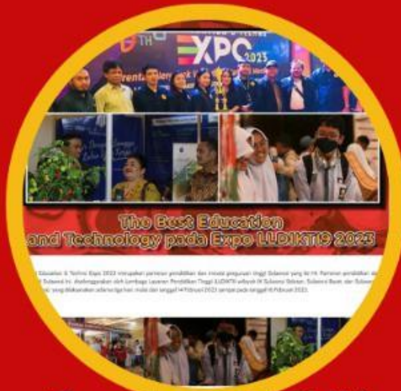
Expo LLDIKTI IX